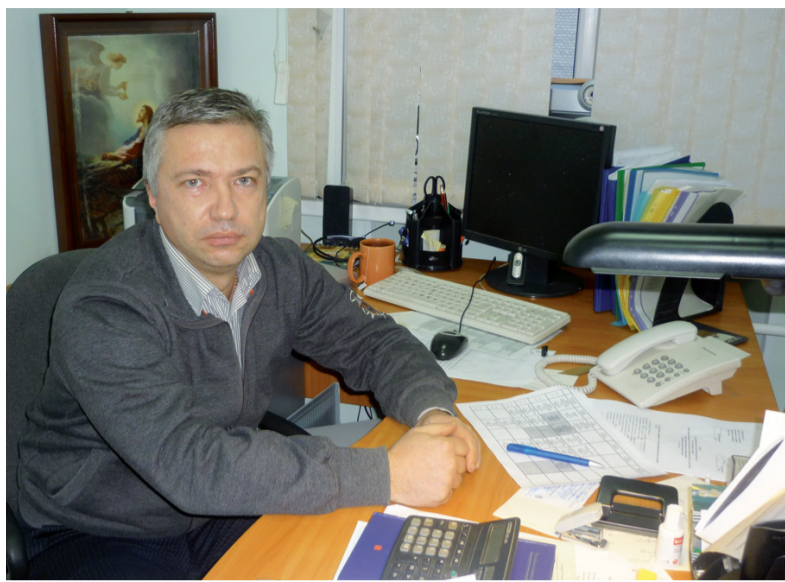
Чтобы усилить работу в сфере обеспечения общественного правопорядка на территории округа муниципальное образование Парнас заключило договор с Санкт-Петербургским Отдельским казачьим обществом «Казачья стража».

С ноября 2011 г. казаки совместно с полицейскими патрулируют улицы, уделяя особое внимание местам наибольшего скопления людей. С момента заключения договора казаки провели более 10 рейдов по охране общественного