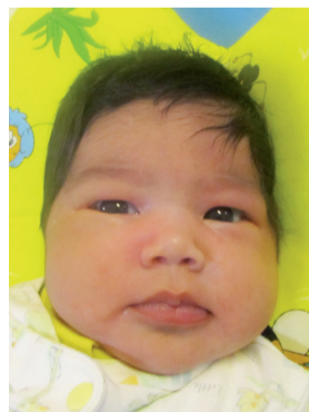
ШАХНОЗА, ноябрь 2011 г/р

Свидетельство о регистрации ПИ № ТУ 78-00405 от 11 сентября 2009 г. Выдано Управлением Федеральной службы по надзору в сфере связи, информационных технологий и массовых коммуникаций по Санкт-Петербургу и Ленинградской области.