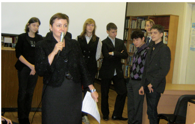
23 декабря в ЦДБ Выборгского района учащиеся 9-го класса школы №114 посмотрели фильм «Есть тема».

Этот фильм профилактического характера снят в рамках проекта «Здоровая Россия». Демонстрация фильма состоялась по инициативе общественной организации социальных программ «XXI век» и МО Парнас.